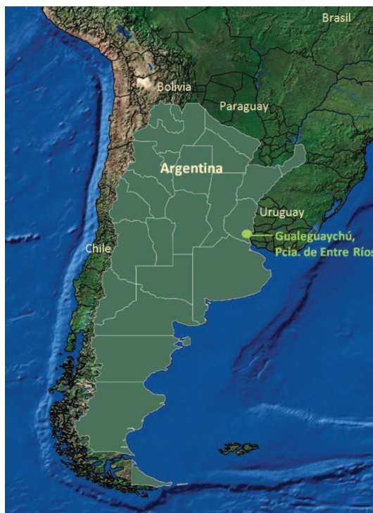
Figura 1. Ubicación de Gualeguaychú, Pcia. de Entre Ríos, Argentina

Este destino turístico, ubicado a orillas del río del mismo nombre, posee un paisaje litoral único y cuenta con innumerables atractivos, algunos relacionados con la vida en la naturaleza, balnearios y playas. Asimismo, tiene recursos basados en las tradiciones locales, tales como el muy consolidado “Carnaval del País”. En los últimos años se ha enfocado también al turismo de salud, debido al descubrimiento de aguas termales y a la apertura de dos centros que brindan servicios específicos sobre la base de este recurso.