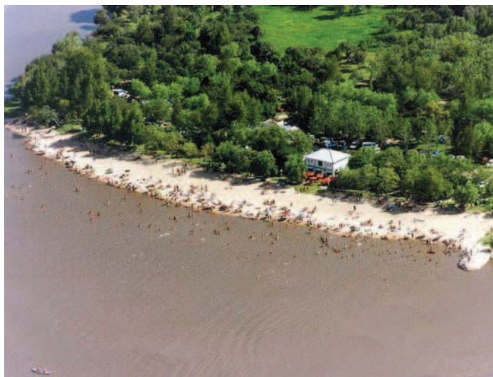
Figura 3. Vista aérea del Balneario Puerta del Sol