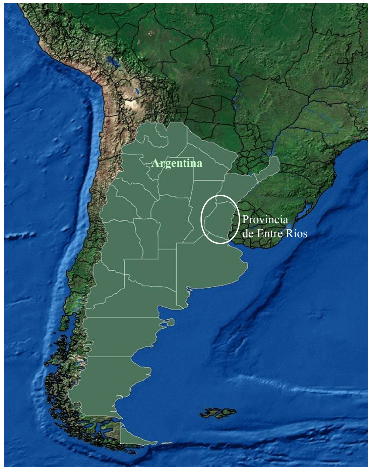
FIGURA 1 Ubicación de la provincia de Entre Ríos, Argentina, en el contexto del Mercosur

Concretamente se ha trabajado en dos proyectos localizados en la provincia de Entre Ríos, Argentina. Uno de ellos ya ha finalizado, en tanto que otro está en sus inicios. Ambos se describen a continuación.